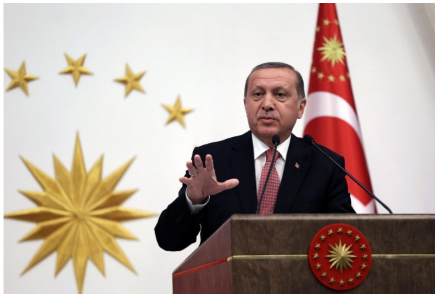
Der türkische Präsident Recep Tayyip Erdogan.

In Istanbul stehen kurdische Anwälte vor Gericht, die Angeklagte der PKK vertreten haben.